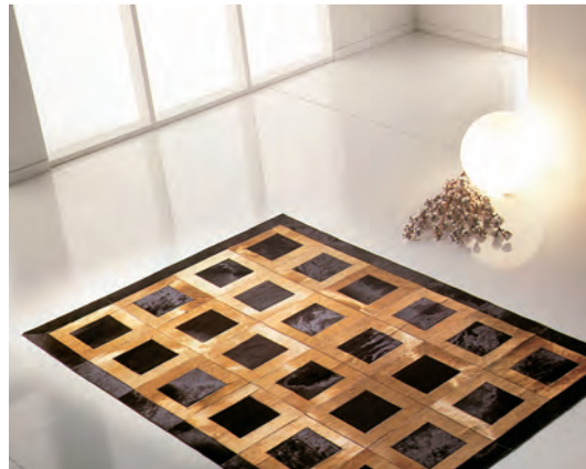
Pelle naturale bovina tinta: testa moro/beige.