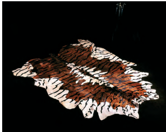
Pelle naturale bovina stampata: tigre.