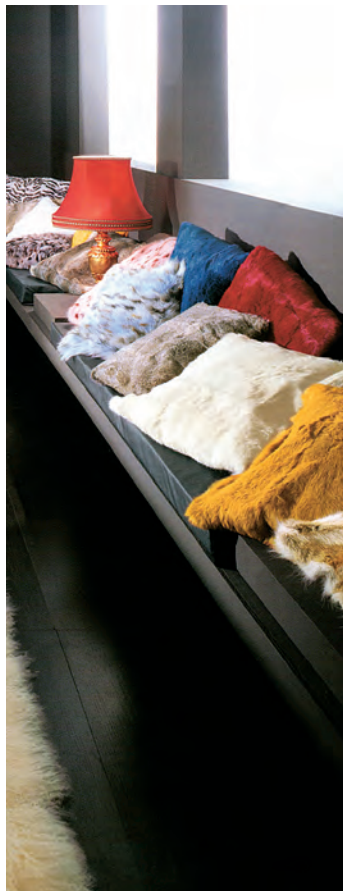
Cuscini in pelliccia.