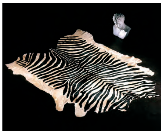
Pelle naturale bovina stampata: tigre.

Tappeti e cuscini sono tra le più antiche tradizioni del mondo, ne esistono di colori, forme e fatture infinite, ma vestire una casa di tappeti realizzati in pellame naturale può donare eleganza e fascino alle nostre abitazioni.